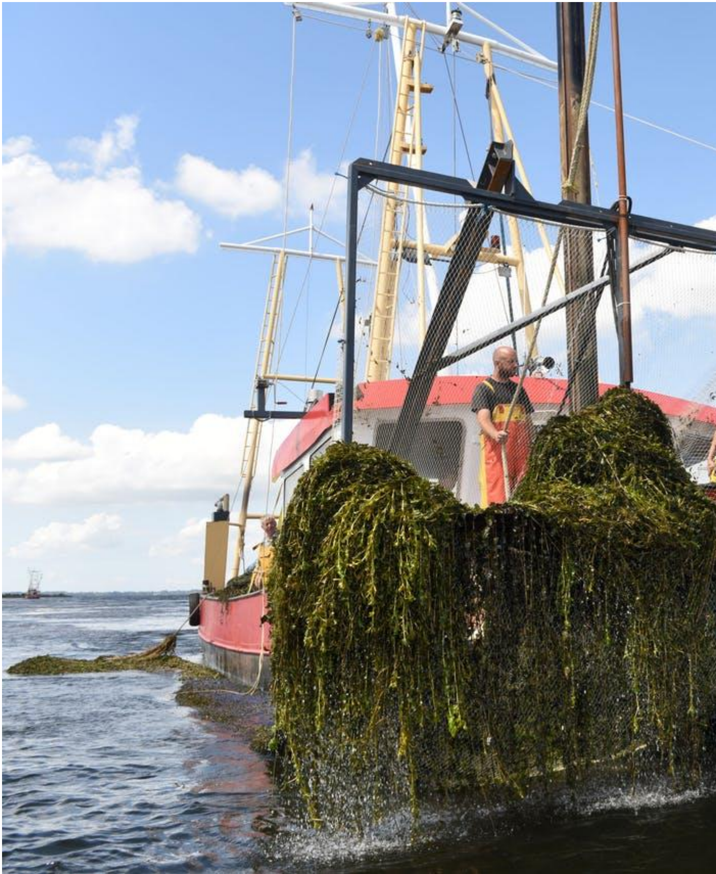
Vissers vangen brasem weg, maar verdienen ook aan het maaien van het wier dat mede daardoor overvloedig kan groeien. 'Dat botst.' Het oogt bijna griezelig. Overal meterslange groene tentakels die vanuit de diepte het wateroppervlak hebben weten te bereiken, zachtjes wuivend, in grote bossen. Wat het extra