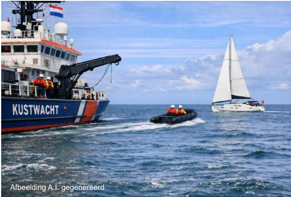
Afbeelding A.I. gegenereerd

De kustwacht controleert intensiever naar aanleiding van recente drugsvondsten langs het strand en de gestegen brandstofprijzen.