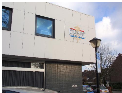
Kantoor KNMC en VNM te Leerdam